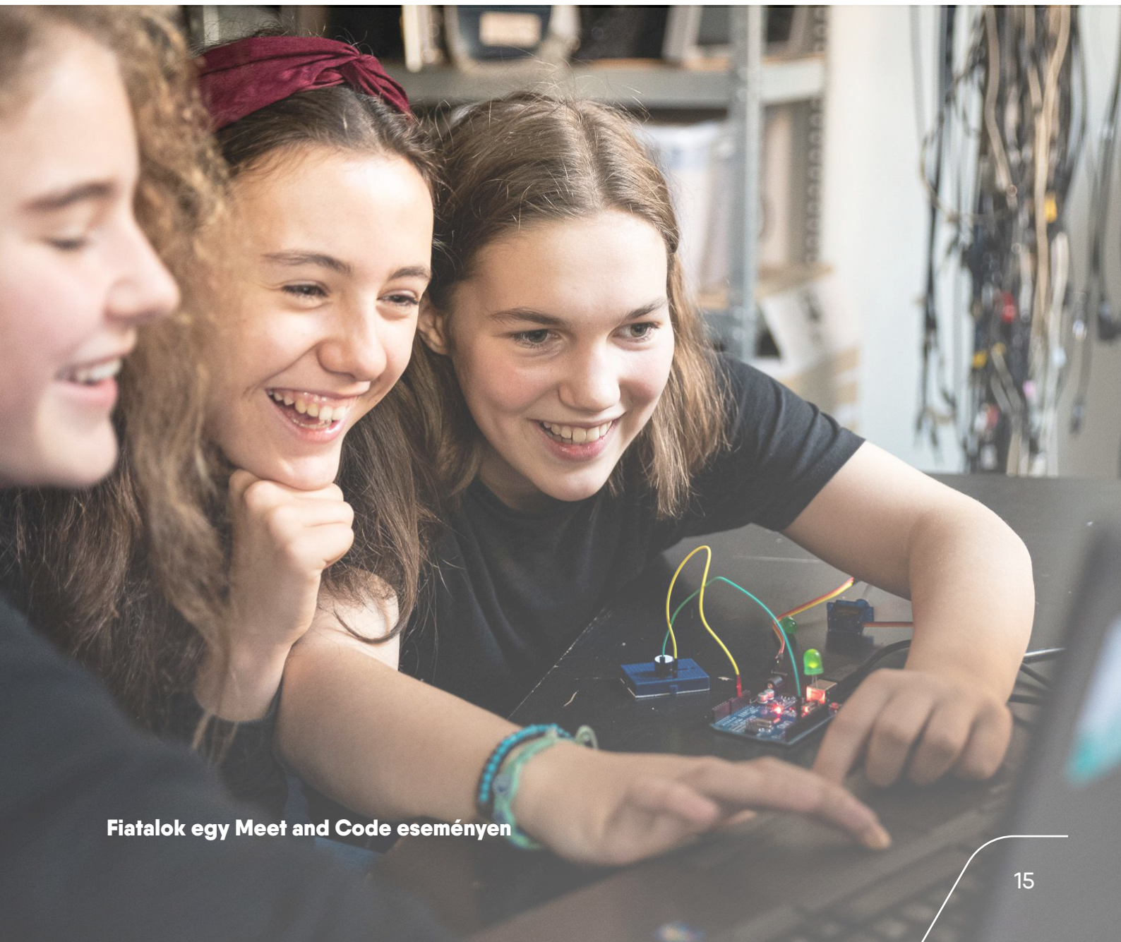
Fiatalok egy Meet and Code eseményen

A CivilTech programban nyújtott validálási szolgáltatásaink mellett különböző vállalatokkal is együttműködünk, hogy pályázatkezelési szolgáltatásokkal támogassuk támogatási kezdeményezéseiket. Az SAP által támogatott és a TechSoup Europe partnerség által működtetett Meet and Code keretében 55 szervezet kapott támogatást a fiataloknak kódolást és digitális készségeket oktató programokhoz. Örömmel láttuk, hogy az évről évre pályázó szervezetek mellett sok új pályázatot nyújtottak be, így egyre több gyerek számára válik lehetővé, hogy belépjen a kódolás és a programozás világába.